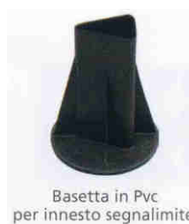
Basetta in Pvc per innesto segnalimite