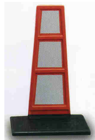
Gomma - Kg 1,5 Rifr. CI 2 - H.I. a norma C.d.S.