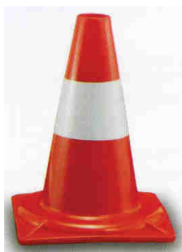
Per aree e parcheggi privati Lavori in aree private