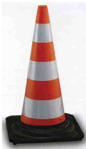
Gomma - Kg.2 Rifr. CI 2 a norma C.d.S.