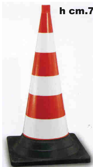
Gomma - Kg 7,5 Rifr. CI 2 - H.I. a norma C.d.S.