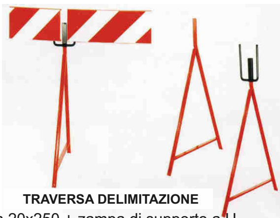
TRAVESSA DELIMITAZIONE cm.20x250 + zampa di supporto a U