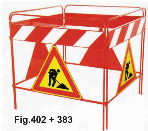
Fig.402 + 383