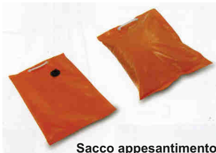
Sacco appesantimento con valvola - cm.40x60 colore arancione