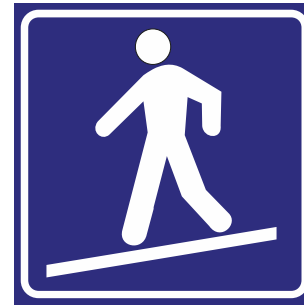
Rampa inclinata pedonale