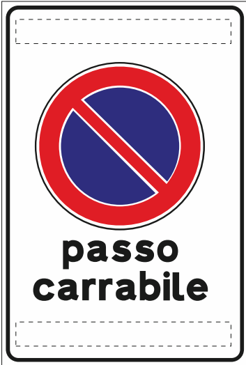
Fig.78 Passo Carrabile