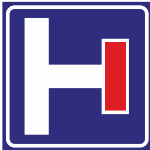
Preavviso strada s/uscita