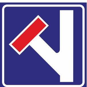
Preavviso strada s/uscita