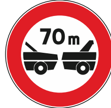
Distanziamento minimo obbligatorio m...