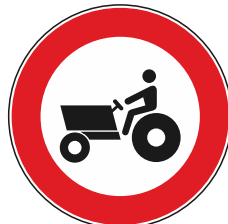
Transito vietato macchine agricole