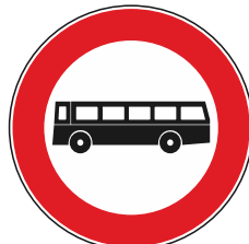
Transito vietato - autobus