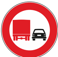
Divieto di sorpasso massa sup. 3,5 T