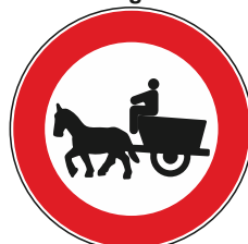
Transito vietato veicoli a traz. animale