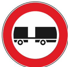
Transito vietato a veicoli c/rimorchio