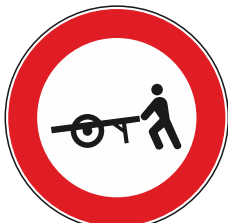
Transito vietato veicoli a braccia