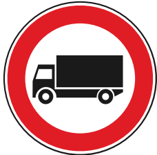
T.V. massa p.carico sup. 3,5 t