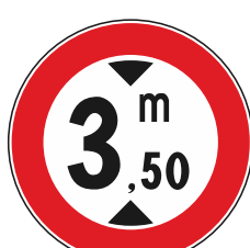
T.V. a veicoli con altezza superiore a mt.....