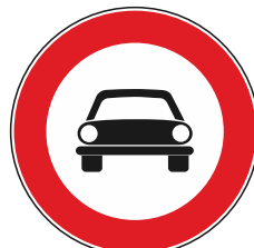
Transito vietato a tutti gli autoveicoli