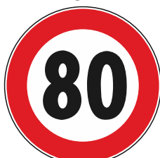
Limite max velocita'