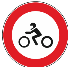
Transito vietato - motocicli