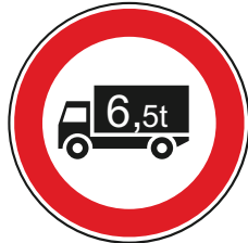
T.V. massa p.carico sup. a ....t