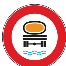
T.V. a veicoli che trasportano prodotti suscettibili a contaminare l'acqua