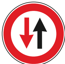
Dare Prec. S.U.A.