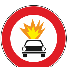
T.V. a veicoli che trasportano esplosivi o prodotti facilmente infiammabili