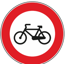
Transito vietato - biciclette