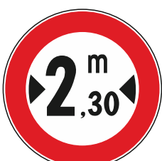
T.V. a veicoli con larghezza superiore a mt.....