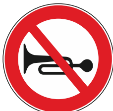
Divieto di segnalazioni acustiche