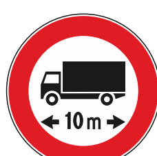
T.V. a veicoli con lunghezza superiore a mt.....