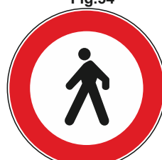
Transito vietato ai pedoni